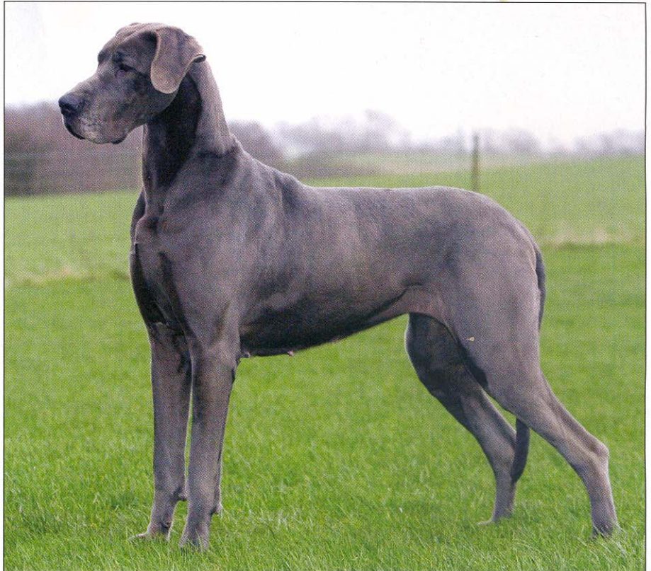
Der er ikke megen pelspleje forbundet med en grand danois. De løse hår fjernes let med et opvredet vaskeskind. Dog skal neglene klippes ofte, så grand danoisen kan stå rigtigt oppe på sine "kattepoter".

Grand danoisen blev opdrættet flere forskellige steder, blandt andet i Tyskland, i tre forskellige varianter (den danske hund, boarhound og ulmer dogge). I 1878 besluttede tyskerne at samle de forskellige varianter under navnet Deutsche Dogge. Denne beslutning gav anledning til nogle kontroverser, og danskerne lagde i 1937 sag an mod tyskerne, eftersom man mente, racen var dansk. FCI (DKK's moderorganisation) anerkendte i den forbindelse Tyskland som oprindelsesland for racen. Imidlertid betegnes racen stadig grand danois eller great dane i hovedparten af verden. I den danske version af standarden be-