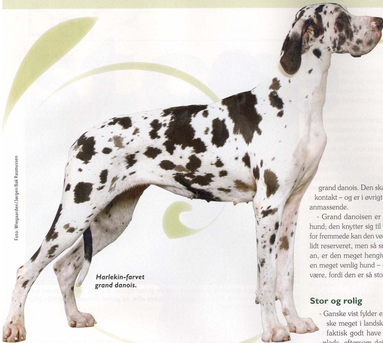
Harlekin-farvet grand danois.

at opdrage til de almindelige ting, en familiehund skal kunne, men vil du for eksempel dyrke lydighed, må du regne med, at tingene tager lidt længere tid end hos så mange andre racer. Den store tålmodighed bærer dog frugt, for med denne race gælder devicen "Én gang lært, aldrig glemt".