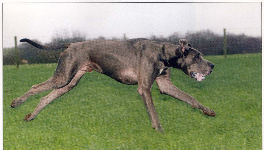
Grand danoisen sætter pris på en løbetur, men dens motionsbehov er ikke overvældende.

- Ganske vist fylder en grand danois ganske meget i landskabet, men man kan faktisk godt have den på relativt lidt plads, eftersom det er en meget rolig hund. Motionsbehovet er ikke voldsomt; løb og tumliture er ok, men den gider ikke særlig længe ad gangen. I øvrigt skal man være varsom med for voldsom motion af ikke-udvoksede grand danoiser, ligesom man bør give dem specialfoder, så længe de er i voksenalderen. Vokser en grand danois for hurtigt, kan skelettet – som ved andre meget store racer – ikke følge med. ■